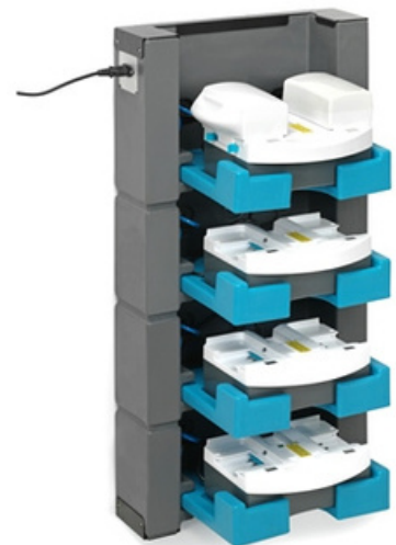
i-stack 4 4 lagen