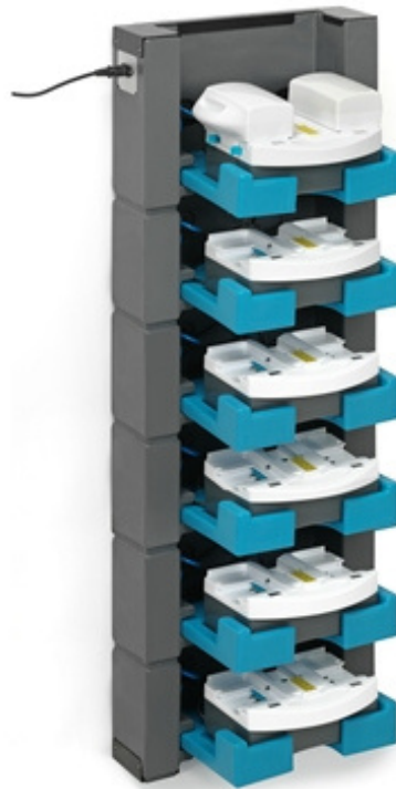
i-stack 6 6 lagen