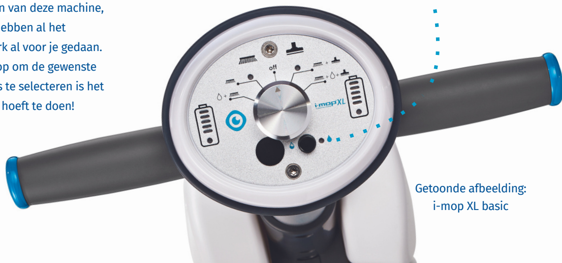
Getoonde afbeelding: i-mop XL basic

Er is geen universitaire studie vereist voor het bedienen van deze machine, want wij hebben al het programmeerwerk al voor je gedaan. Een simpele knop om de gewenste bedieningsmodus te selecteren is het enige wat je hoeft te doen!