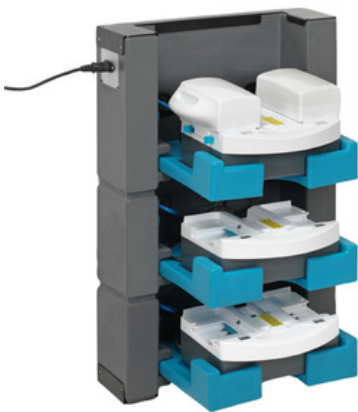
i-stack 3 3 lagen

Ruimte is schaars tegenwoordig. We hebben geen centimeter te verspillen als het gaat om de beperkte opslagruimte die ons ter beschikking staat. Daarom bedachten we: waarom gaan we niet de hoogte in richting het plafond voor het opladen van uw batterijen? Je hebt slechts één enkel stopcontact nodig voor meerdere opladers. Nu kan je eenvoudig jouw batterijen bevestigen, aansluiten en opladen zonder kostbare ruimte te verliezen!