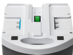
i-charge 2 K.1.S.72.0299.0