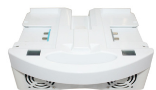
i-charge 9 K.1.S.72.0344.0